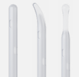
Nelatone Tiemann Flexible

Faltbar auf ein handliches, diskretes Taschenformat.